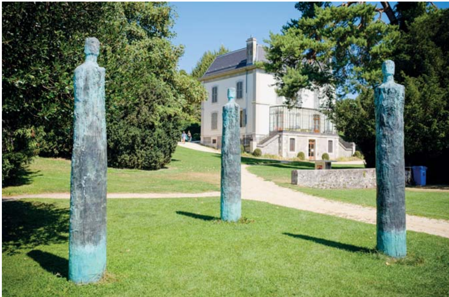
L'œuvre emblématique de Pierre Golay, «Hommage à la musique – Trio», est au cœur de cet anniversaire. CÉDRIC SANDOZ

Il y a d'abord cette balade dans les rues nyonnaises qui invite les curieux à découvrir plusieurs reproductions de dessins réalisés par l'artiste, des œuvres toutes liées au trio de statues. En tout, neuf affiches occupent des panneaux prêtés par la Ville. A ceux-ci