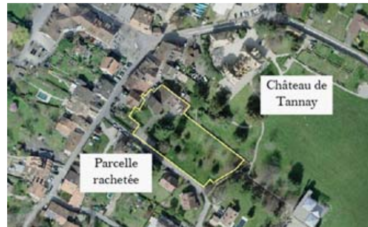
Attenante au jardin du château, la nouvelle parcelle permettra d'agrandir le parc public. OPENSTREETMAP

Convaincus, les conseillers communaux ont accepté à l'unanimité le préavis, décision saluée par un tonnerre d'applaudissements. ROJ